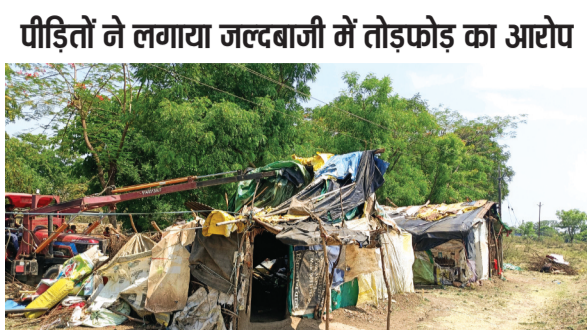
हरिभूमि न्यूज़ ►► सिवनी मालवा

नंदरवाड़ा रोड बाईपास स्थित नहर विभाग की जमीन पर गुरुवार दोपहर बड़ी कार्रवाई करते हुए विभागीय अमले ने अतिक्रमण हटाया। जैसीबी मशीन की मदद से यहां बनी 10 से 12 झोपड़ियों को हटाया गया, जिससे वहां रह रहे करीब 12 परिवार बेघर हो गए। कार्रवाई के दौरान परिवारों का घरेलू सामान भी खुले आसमान के नीचे आ गया। स्थानीय लोगों के अनुसार गुरुवार दोपहर नहर विभाग की टीम अतिक्रमण जैसीबी लेकर मौके पर पहुंची और झोपड़ियों को हटाने की कार्रवाई शुरू कर दी। कार्रवाई के दौरान क्षेत्र में अफरा-तफरी का माहौल बन गया। महिलाएं और बच्चे सामान बचाने में जुटे नजर आए।