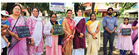
हरिभूमि न्यूज़ ►► पचमढ़ी

महिला एवं बाल विकास विभाग के तत्वावधान में 9 अप्रैल से संचालित 8वां पोषण पखवाड़ा गुरुवार, 23 अप्रैल को सफलतापूर्वक संपन्न हुआ। पखवाड़े का समापन कार्यक्रम पचमढ़ी के वार्ड नंबर 04 में गरिमावन् वातावरण में आयोजित किया गया। बीते 15 दिनों के दौरान क्षेत्र के समस्त आंगनवाड़ी केंद्रों में मातृ एवं शिशु पोषण, प्रारंभिक बाल्यावस्था